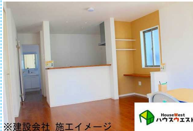
※建設会社 施工イメージ