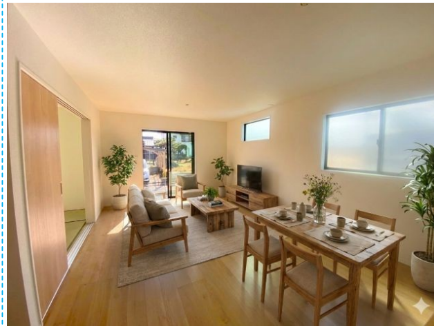
リビング ※家具はイメージです