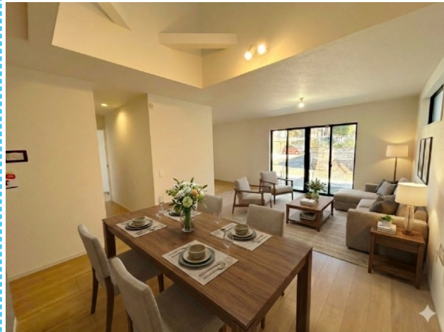
リビング ※家具はイメージです