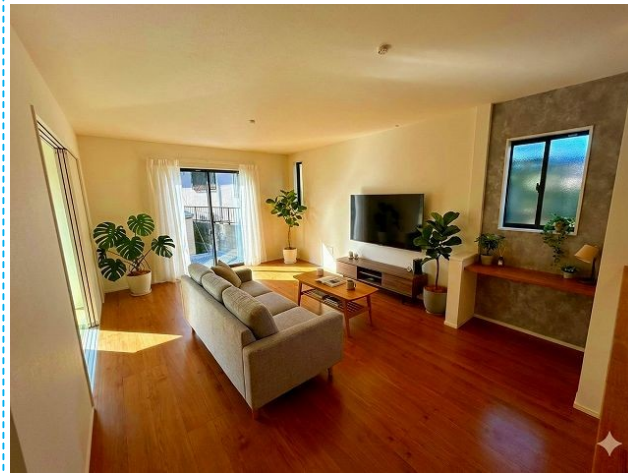
リビング ※家具はイメージです