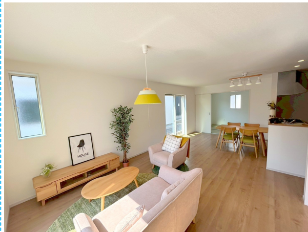
リビング ※家具はイメージです