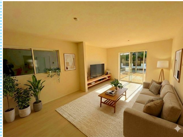
リビング ※家具はイメージです