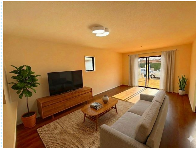
リビング ※家具はイメージです