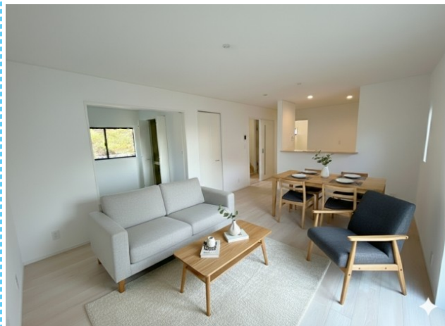
リビング ※家具はイメージです