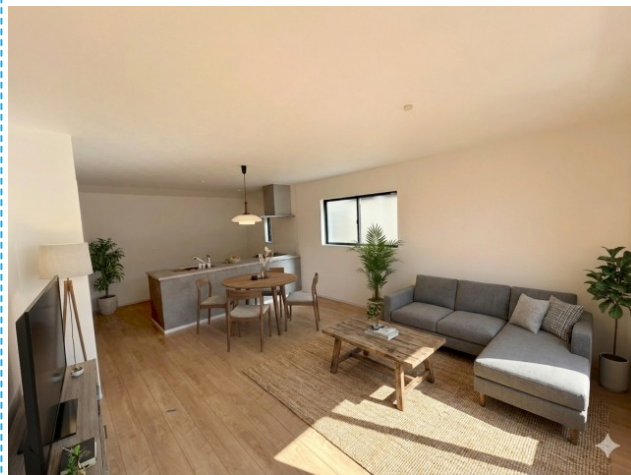
リビング ※家具はイメージです