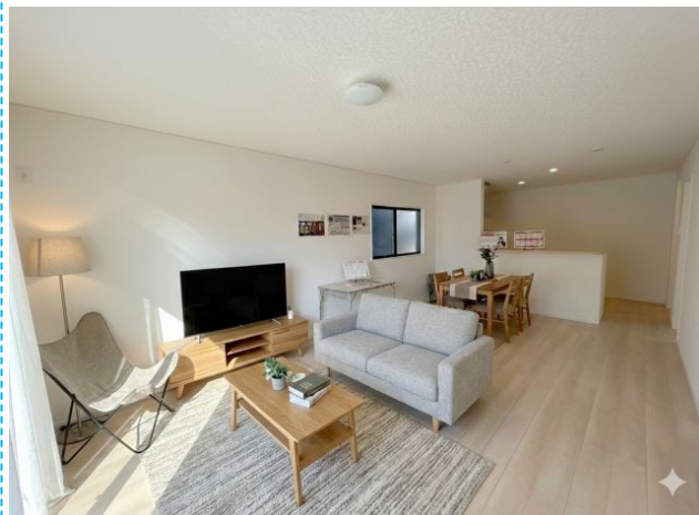
リビング ※家具はイメージです