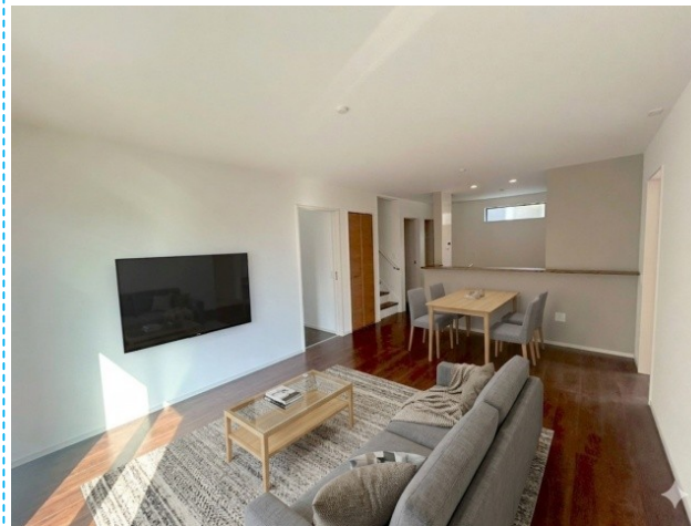
リビング ※家具はイメージです