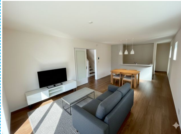
リビング ※家具はイメージです