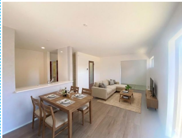
リビング ※家具はイメージです