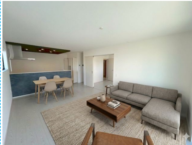
リビング ※家具はイメージです