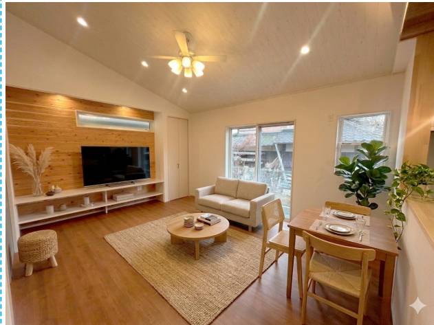
リビング ※家具はイメージです