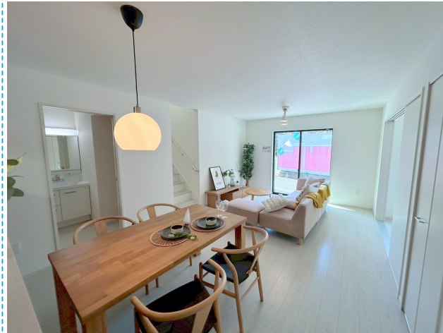
リビング ※家具はイメージです