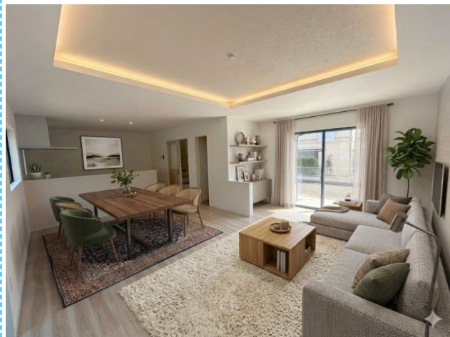
リビング ※家具・照明はイメージです