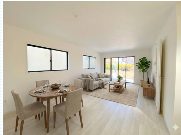
リビング ※家具はイメージです