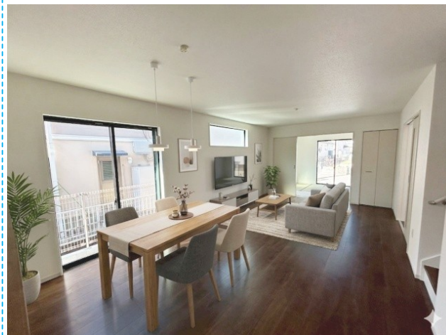
リビング ※家具はイメージです