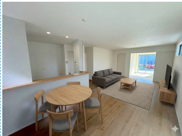
リビング ※家具はイメージです