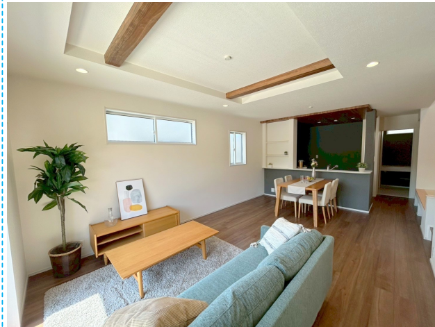
リビング ※家具はイメージです