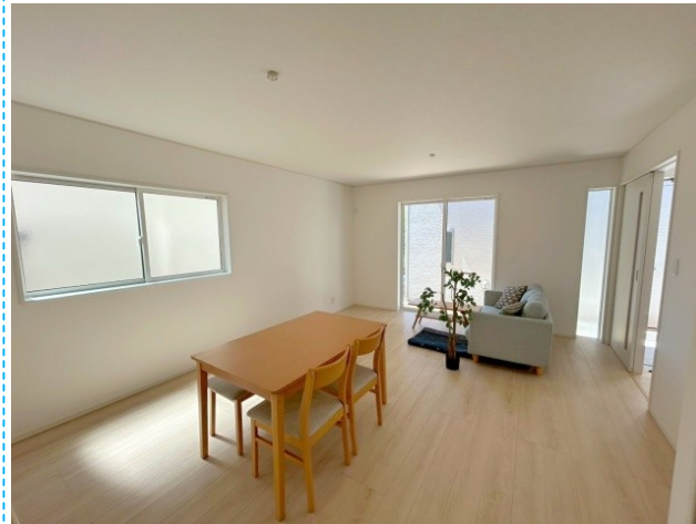
リビング ※家具はイメージです